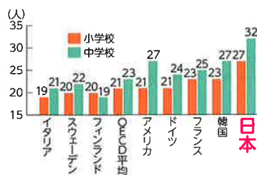
OECD「図表で見る教育」2020年度版より