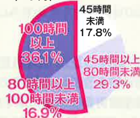
(全国の教職員2524人の2022年10月下旬の勤務実態から計算) (全教「教職員勤務実態調査2022」より)