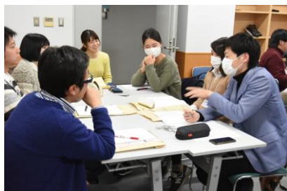
これまでの「TANE！」の様子