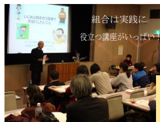
組合は実践に 役立つ講座がいっぱい!

元早稲田大学教職支援センター・教員就職アドバイザー 元大東文化大学教職課程センター 元都内公立小学校校長