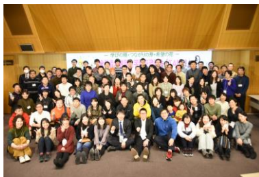
全国の青年教職員が集結！