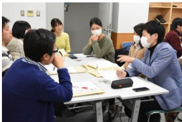
なんでも聞けます話せます分科会

平和ってなんだろう？戦争が起こるとい現実を知って、中学校の先生と子どもたちとで学び、育んできた「心に平和の砦を築く」とは？平和を守り続けるとはどういうことか、語り合いませんか？子どもたちの平和に対するきっかけづくりや、校種は違っても、見える子どもの背中をズームイン！