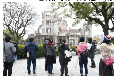
社会と教育をつなぐ講座も