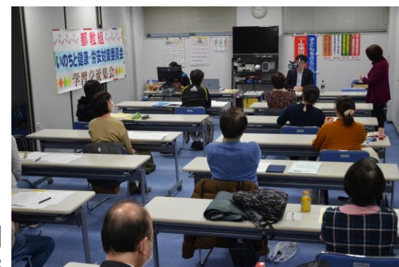
2020年度 学習交流会の様子

産業医は、教職員の健康管理を行うだけでなく、安全衛生の専門的視点から勤務実態、作業環境、衛生状態などの点検を行い、事業者（教育委員会や校長）に対してアドバイスする役割も担っている医師です。コロナ禍で、教職員の長時間過密労働はますます深刻さを増しています。教職員が健康でいきいき働き続けるためにも、学校の労安体制の確立はますます重要になっています。今回は、産業医の立場からの具体的助言もいただきながら、参加者全体で教職員の働き方をいっしょに考え合ひましょう。