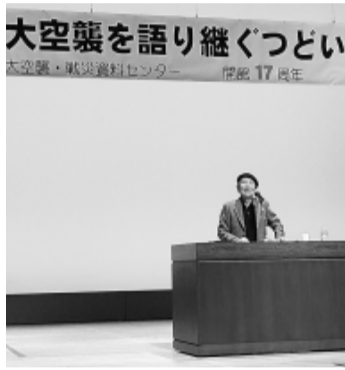
大空襲を語り継ぐつどい 大空襲・戦災資料センター 館17周年

「小さいうち」などの小説で空襲を描く直木賞作家の中島京子さんは、「記憶を受け取る想像力の鍛え方」と題して講演を行い、「東京大空襲は、東京に生きて暮らしている人間として、受け取らなければならない記憶だ」とし、参加者に力強く訴えました。