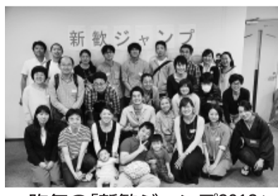
昨年の「新歓ジャンプ2018」

組合・共済のなかまを増やし、都教組の「変える力」「支える力」を強くしよう 新採者も当然、組合に加入できず、臨時的任用(期限付・産育休代替)の方も含めて、組合に入ることで、自分を守ることもできます。また、多くの情報も得られ、学ぶことで自分を高める力にもなります。 青年部学習会 「新歓ジャンプ2019」に参加を 都教組青年部では新採者を歓迎し、青年の交流の場として「新歓ジャンプ2019」を開催します。新採者や青年教職員のみならず、ぜひ一緒に参加ください。 新歓ジャンプ2019 ● 4月20日(土) 14時~16時 南大塚地域文化創造館 ● JR大塚駅南口徒歩5分 ● 「教えて!みんなどうしている?」青年組合員によるレポート報告 ● 参加費 無料 (学級づくり、算数の授業、特別支援教育)はるカフェ(同じ地域で働いている教職員とのつながりづくり、おしゃべり)