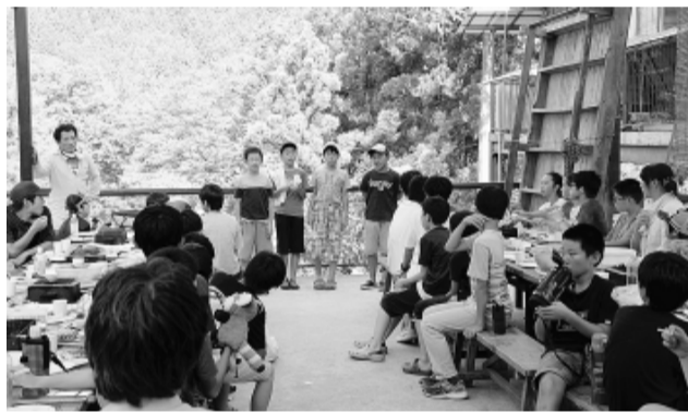
昨年の「のびのびタイムⅦ」

都教組執行部は、組合員のみならず、組合員を合わせ、職場の要求を基本に運動をすすめます