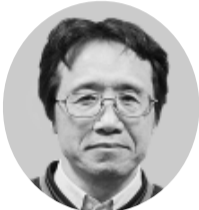
財政部長 古屋 茂樹